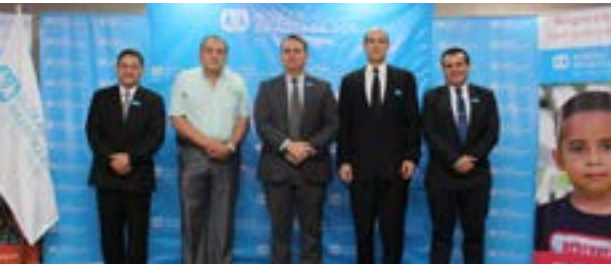
Miembros de Junta Directiva período 2018 - 2020